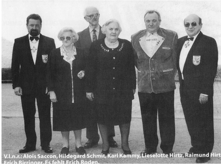
Gründungsmitglieder im Jahr 1989